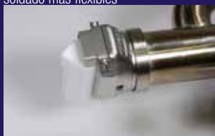
Zapatas de soldadura de rápida sustitución y giratorias en 360° para una alta productividad