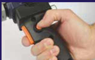
Botones de bloqueo para una soldadura de extrusión continua con poco esfuerzo