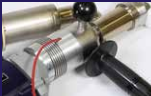
Varillas de soldadura fáciles de insertar a ambos lados para facilitar posturas de soldado más flexibles