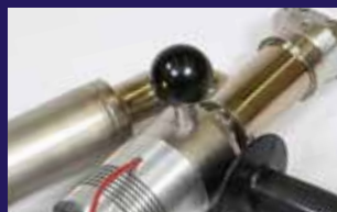
Mango y reguladores extraíbles a ambos lados para ayudar a mantener su herramienta más limpia