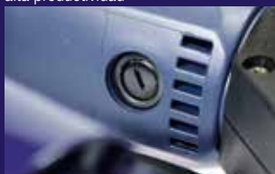
Escobilla de carbón fácil y rápida de cambiar