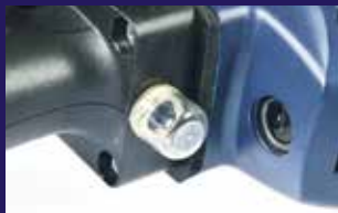
Protección visible contra las sobrecargas para un mayor control