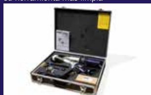
Robusto maletín para un almacenamiento ordenado y sin polvo (incluido en la compra)