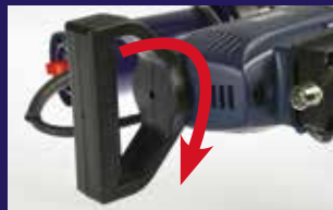
Mango giratorio para una ergonomía mejorada